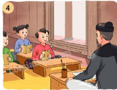
Vì sao Vũ Duệ được đi học?