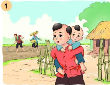
Vì sao cậu bé Vũ Duệ không được đi học?

Câu 2: Chọn kể 1 – 2 đoạn của câu chuyện theo tranh: