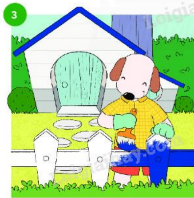
Cún con cũng quyết định thay đổi cách trang trí khu vườn.