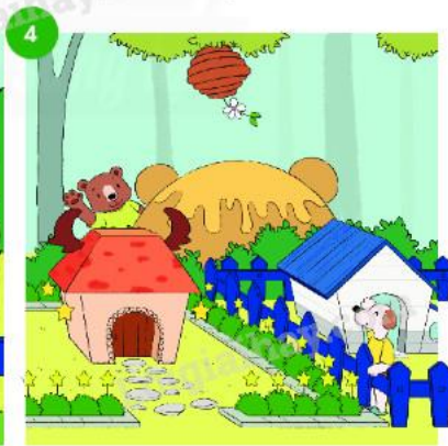
Những khu vườn của phố Cây Xanh được trang trí khác nhau.