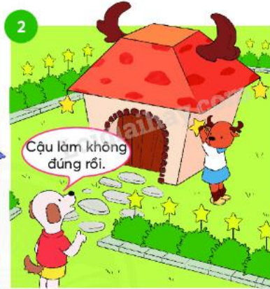
Hươu con trang trí khu vườn theo cách mình yêu thích.