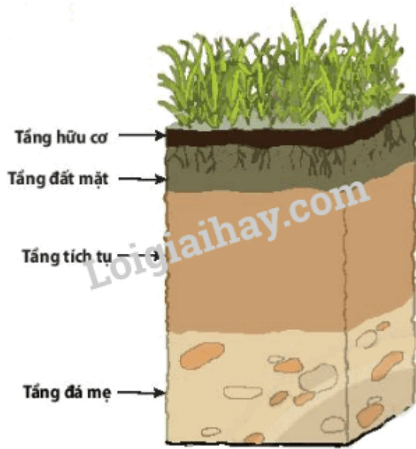
Hình 19.2. Mẫu đất