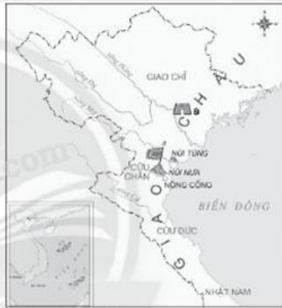
Khởi nghĩa Bà Triệu