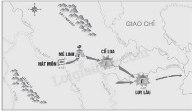
Khởi nghĩa Hai Bà Trưng