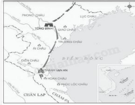
Khởi nghĩa Mai Thúc Loan