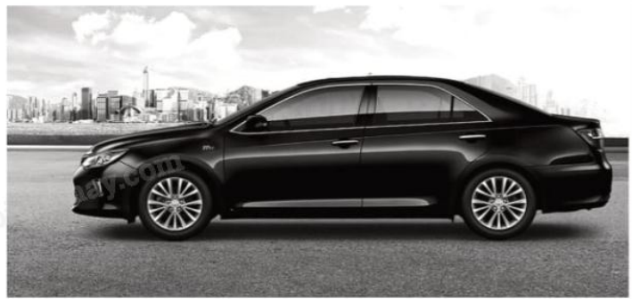
Hình 1.2. Ô tô năm 2020