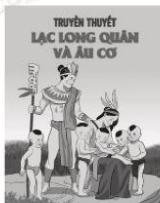
Hình 1.6. Truyền thuyết Lạc Long Quân và Âu Cơ