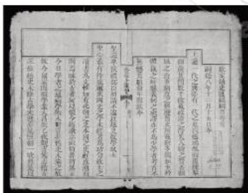
Hình 1.5. Một trang sách trong cuốn Khâm định Việt sử Thông giám cương mục