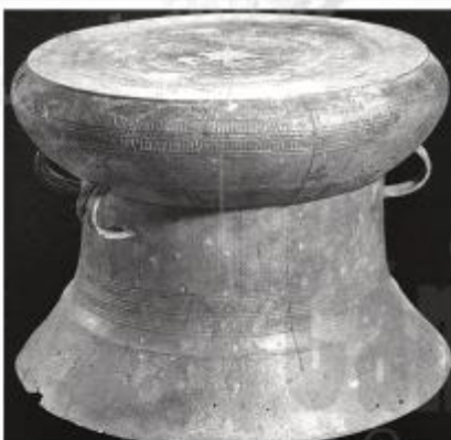
Hình 1.3. Trống đồng Ngọc Lũ

Hãy cho biết các hình ảnh dưới đây thuộc tư liệu lịch sử nào? nêu ý nghĩa của một trong các loại tư liệu lịch sử đó