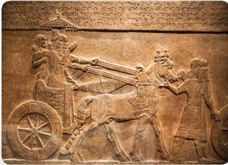
▲ Hình 5. Một tác phẩm điêu khắc của người Lương Hà miêu tả việc sử dụng bánh xe

2.2 Hình 5 (trang 32, SGK) cho em biết điều gì về người Lương Hà cổ đại?