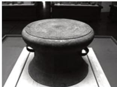
Hình 13.3. Trống đồng Cổ Loa