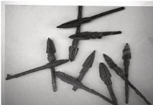
Hình 13.4. Mũi tên đồng Cổ Loa