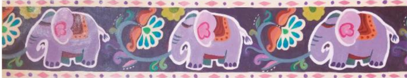
Đàn voi, sản phẩm mỹ thuật từ màu bột, Lê Phương Dung