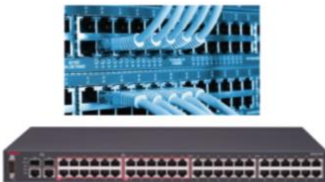
Hình 3. Switch