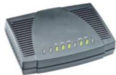
Hình 4. Modem