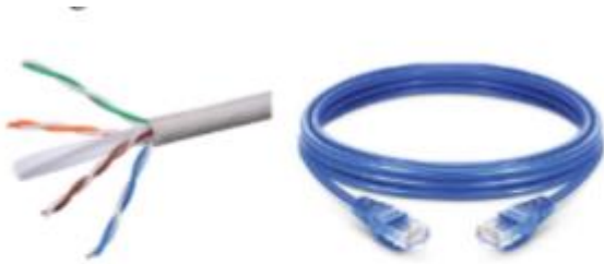
Hình 2a. Cáp xoắn