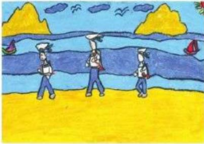
Các chú hải quân tuần tra biển Tranh vẽ của học sinh