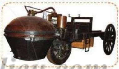
Xe Cugnot Fardier (Nicolas-Joseph Cugnot, 1769)

Em hãy quan sát các hình ảnh và cho biết