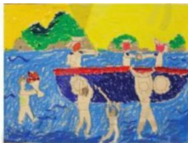
2 Vẽ màu khái quát