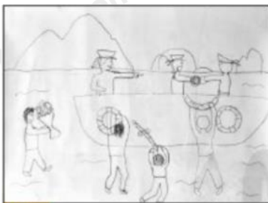
1 Vẽ hình và bố cục