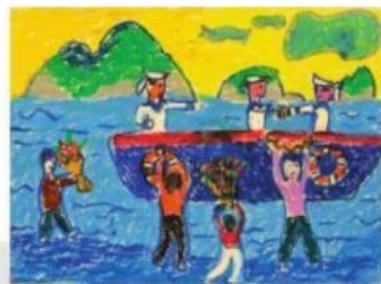
3 Vẽ chi tiết và hoàn thiện