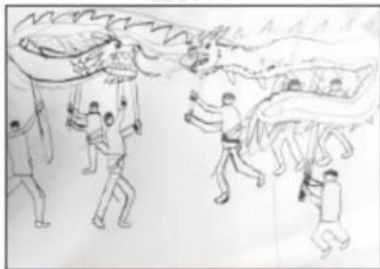
1. Vẽ hình và bố cục