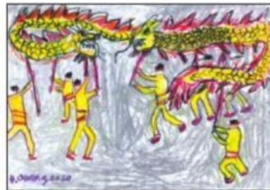
3. Vẽ chi tiết và hoàn thiện