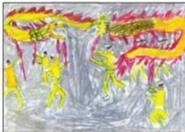
2. Vẽ màu khái quát