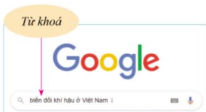
Hình 1. Màn hình nhập từ khoá tìm kiếm trên Google