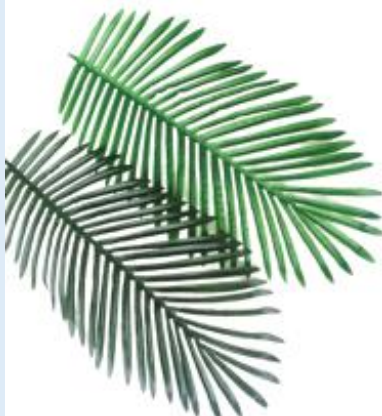
Lá dừa nước