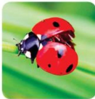
Con bọ dừa