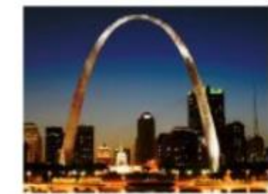
Cổng Arch (St. Louis, Mỹ)

Câu 37: Khi du lịch đến thành phố St. Louis (Mỹ), ta sẽ thấy một cái cổng lớn có hình parabol hướng bề lõm xuống dưới, đó là cổng Arch. Giả sử ta lập một hệ tọa độ Oxy sao cho một chân cổng đi qua gốc O như Hình 16 (x và y tính bằng mét), chân kia của cổng ở vị trí có tọa độ (162; 0). Biết một điểm M trên cổng có tọa độ là (10; 43).