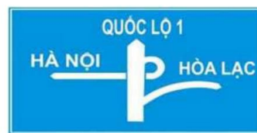
Biển báo 4