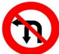
Biển báo 3