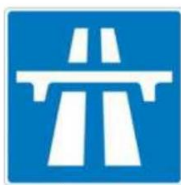
Biển báo 2