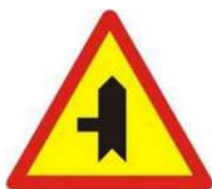
Biển báo 1

Câu 9. Trong các biển báo giao thông sau, biển báo nào có hình dạng là tam giác đều?