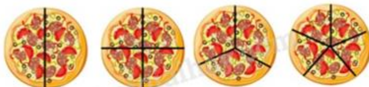
Hình 1 Hình 2 Hình 3 Hình 4

Câu 3. Hình vẽ nào dưới đây chia miếng bánh thành 5 phần bằng nhau?