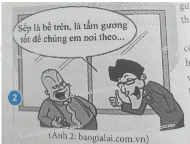
(Ảnh 2: baogialai.com.vn)