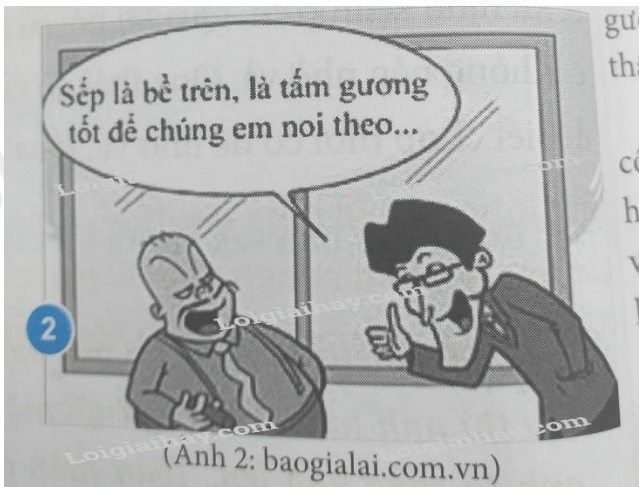
(Ảnh 2: baogialai.com.vn)