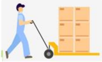
a) Người đẩy xe hàng

Câu 5: Sắp xếp các lực trong các trường hợp sau theo độ lớn tăng dần