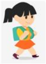
c) Học sinh đeo ba lô