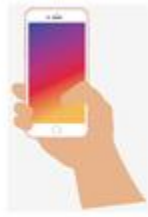
b) Tay bấm điện thoại