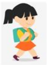
c) Học sinh đeo ba lô