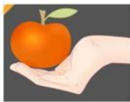
d) Tay cầm quả táo